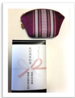
関西支部 60周年記念品