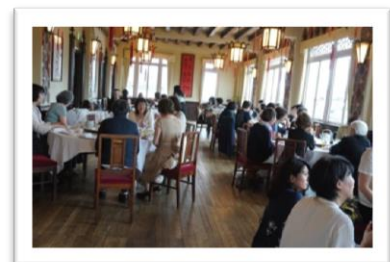
和やかな会食風景